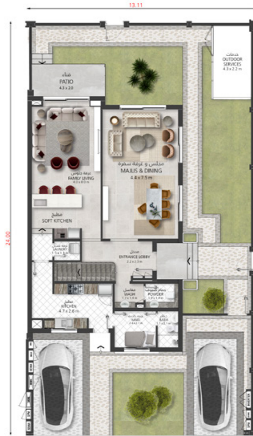
الطابق الأرضي Ground Floor