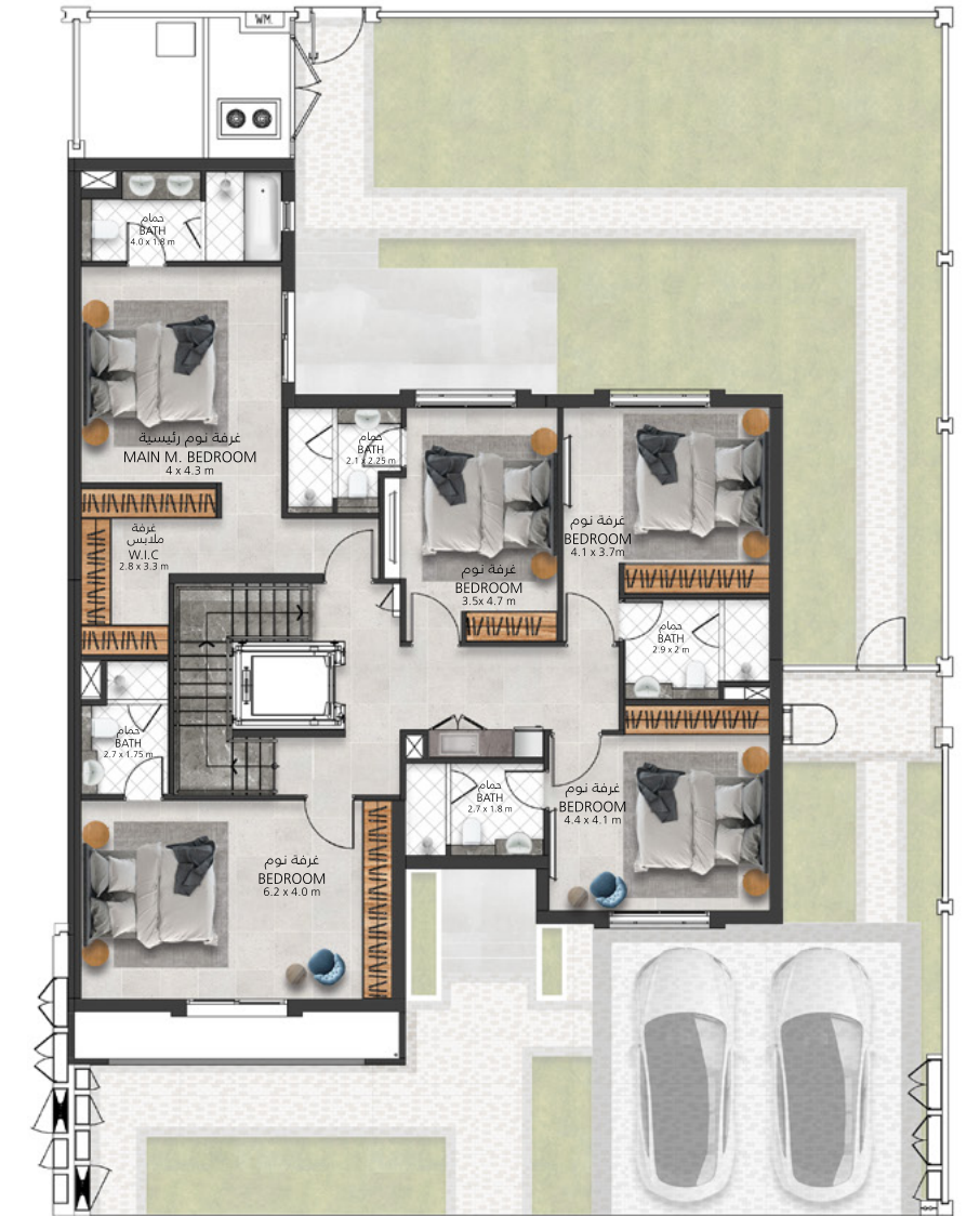
الطابق الأول First Floor