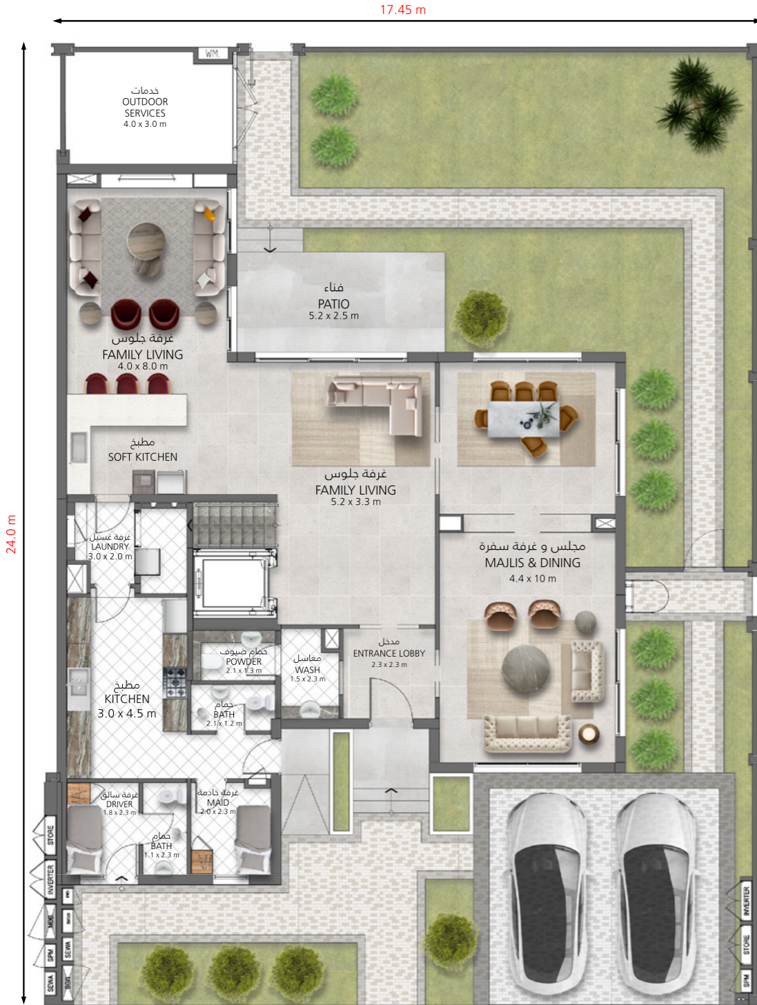
الطابق الأرضي Ground Floor