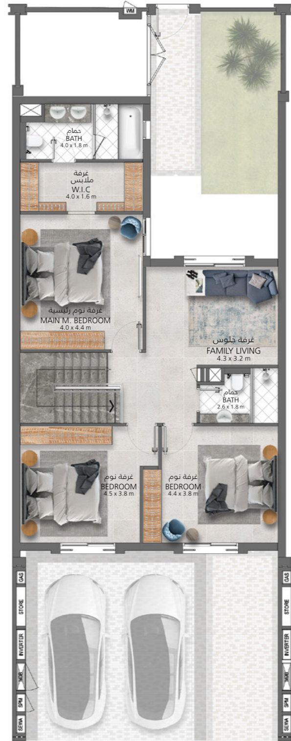
الطابق الأول First Floor