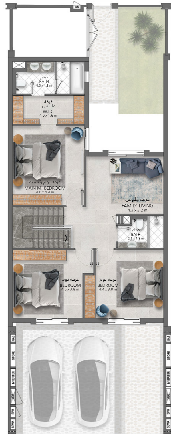
الطابق الأول First Floor