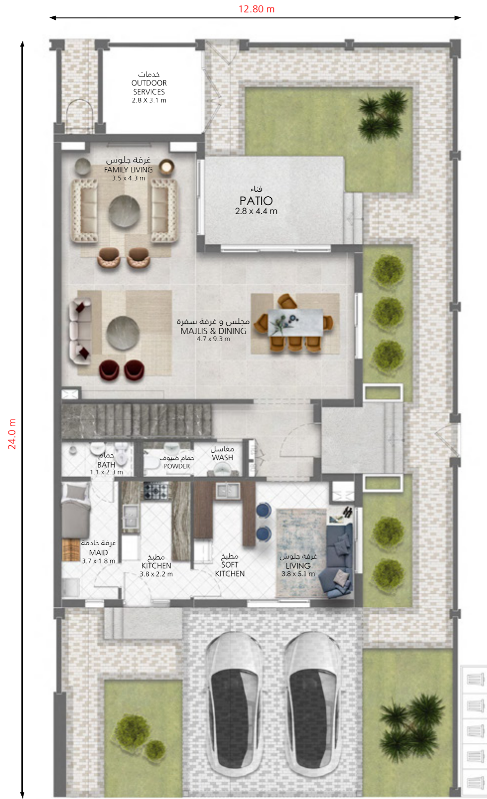
الطابق الأرضي Ground Floor