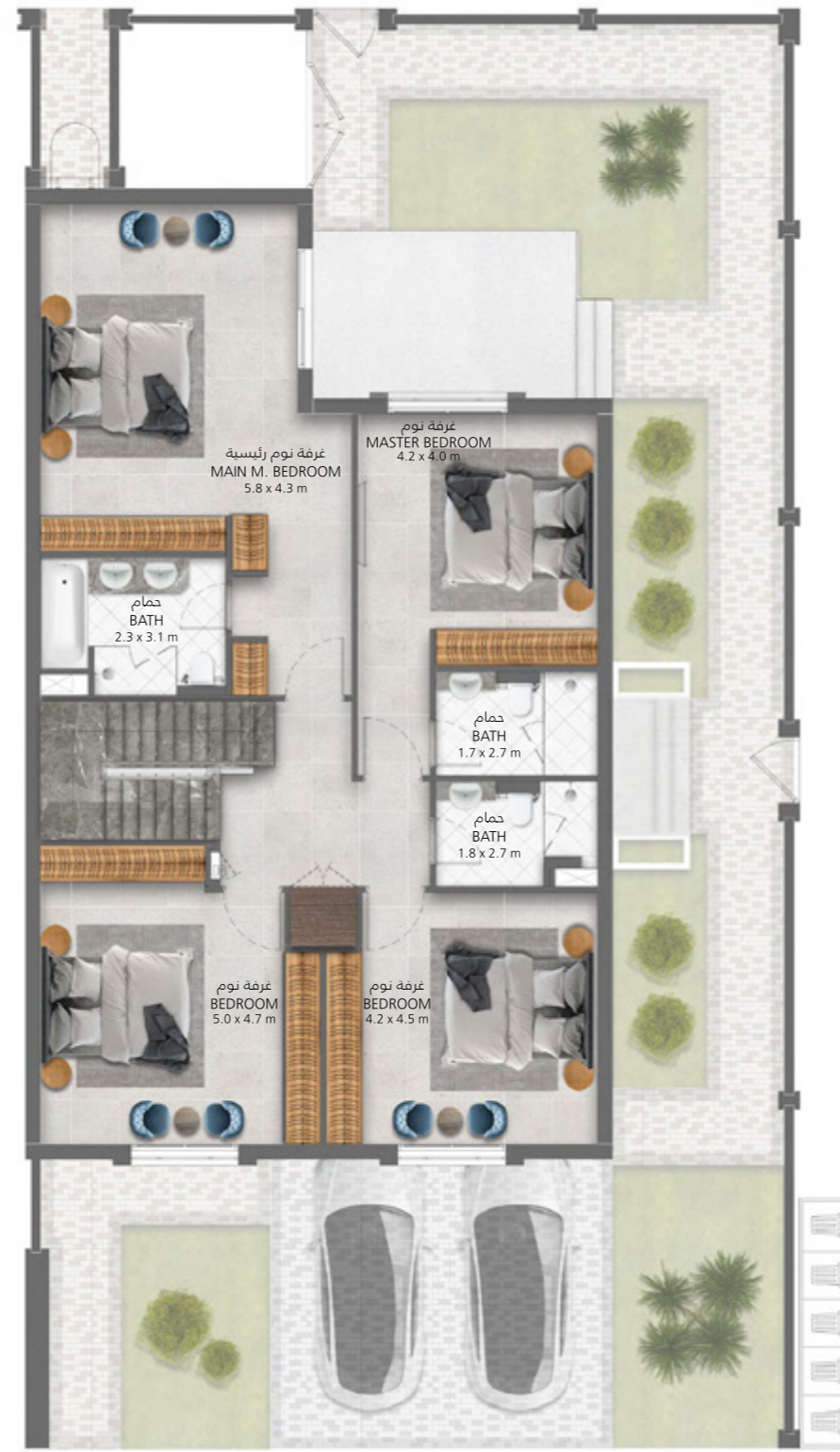
الطابق الأول First Floor