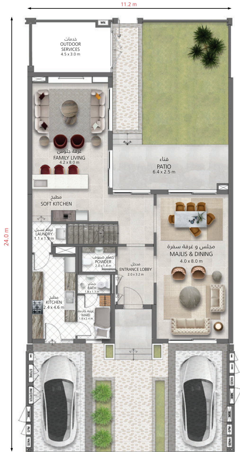
الطابق الأرضي Ground Floor