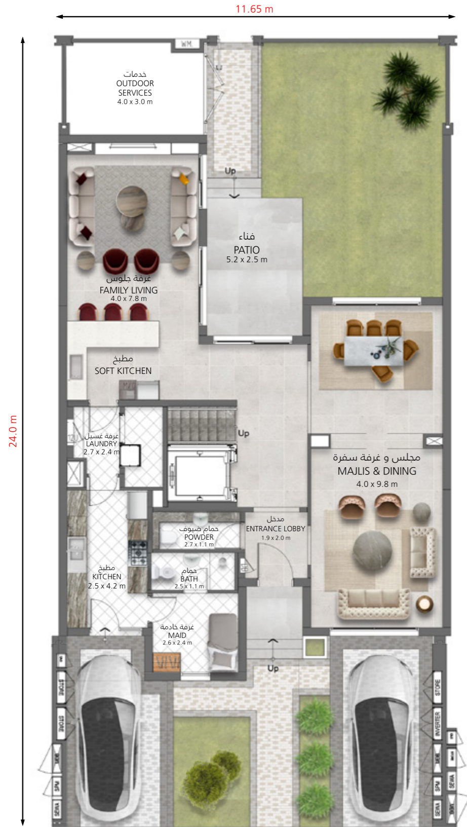
الطابق الأرضي Ground Floor