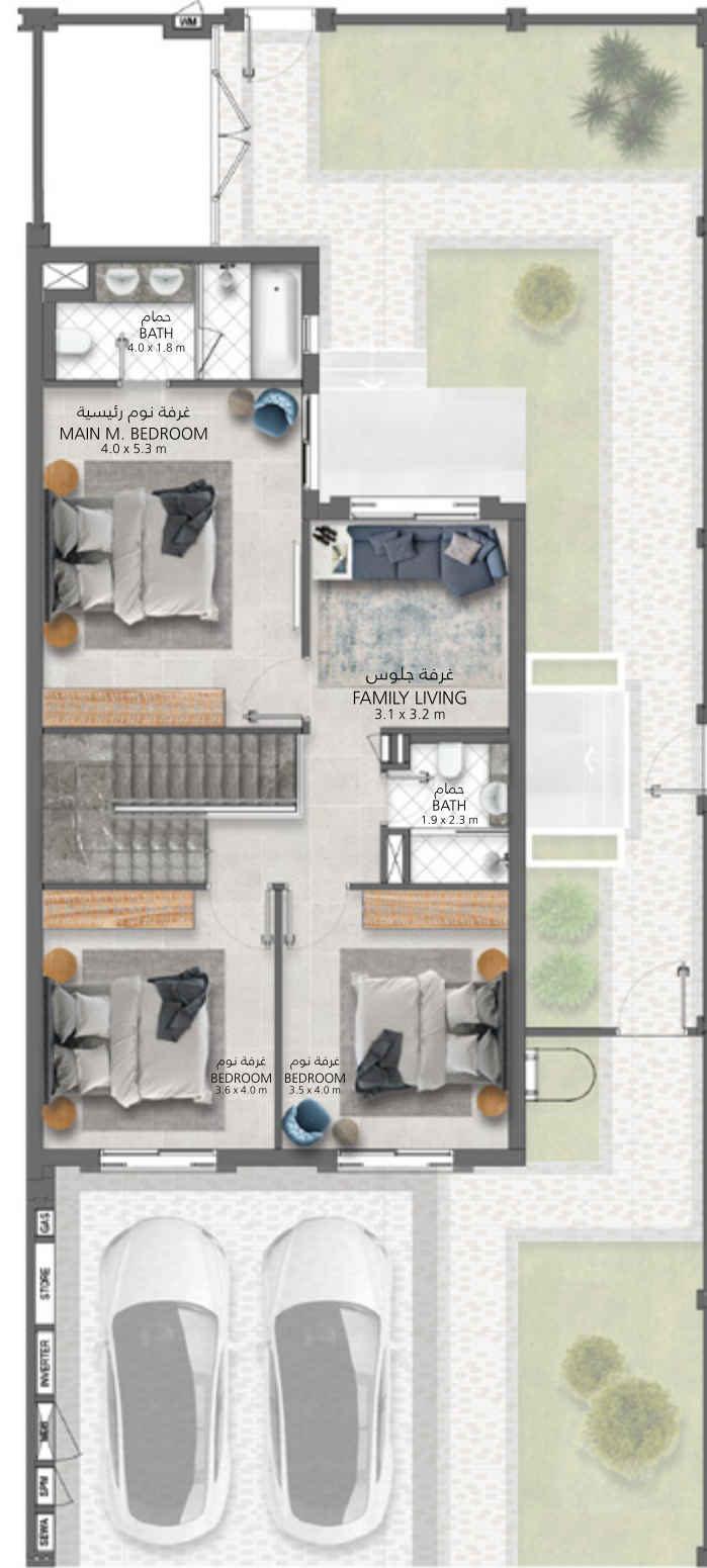
الطابق الأول First Floor