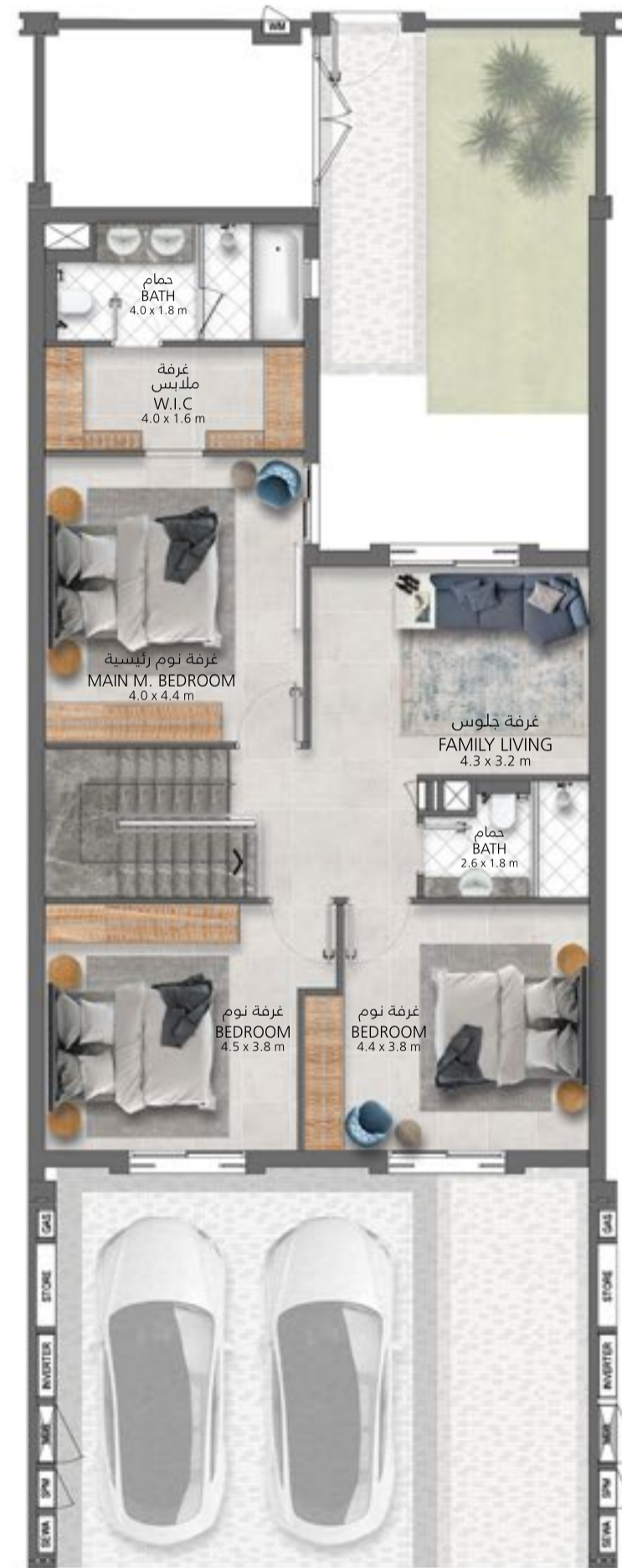
الطابق الأول First Floor