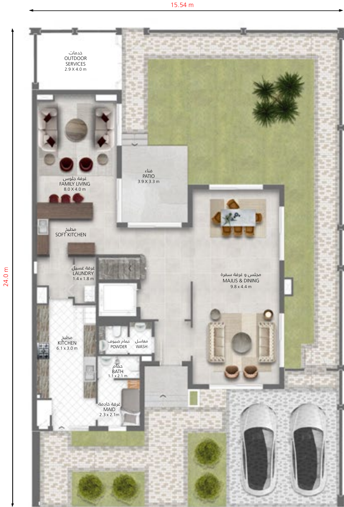
الطابق الأرضي Ground Floor