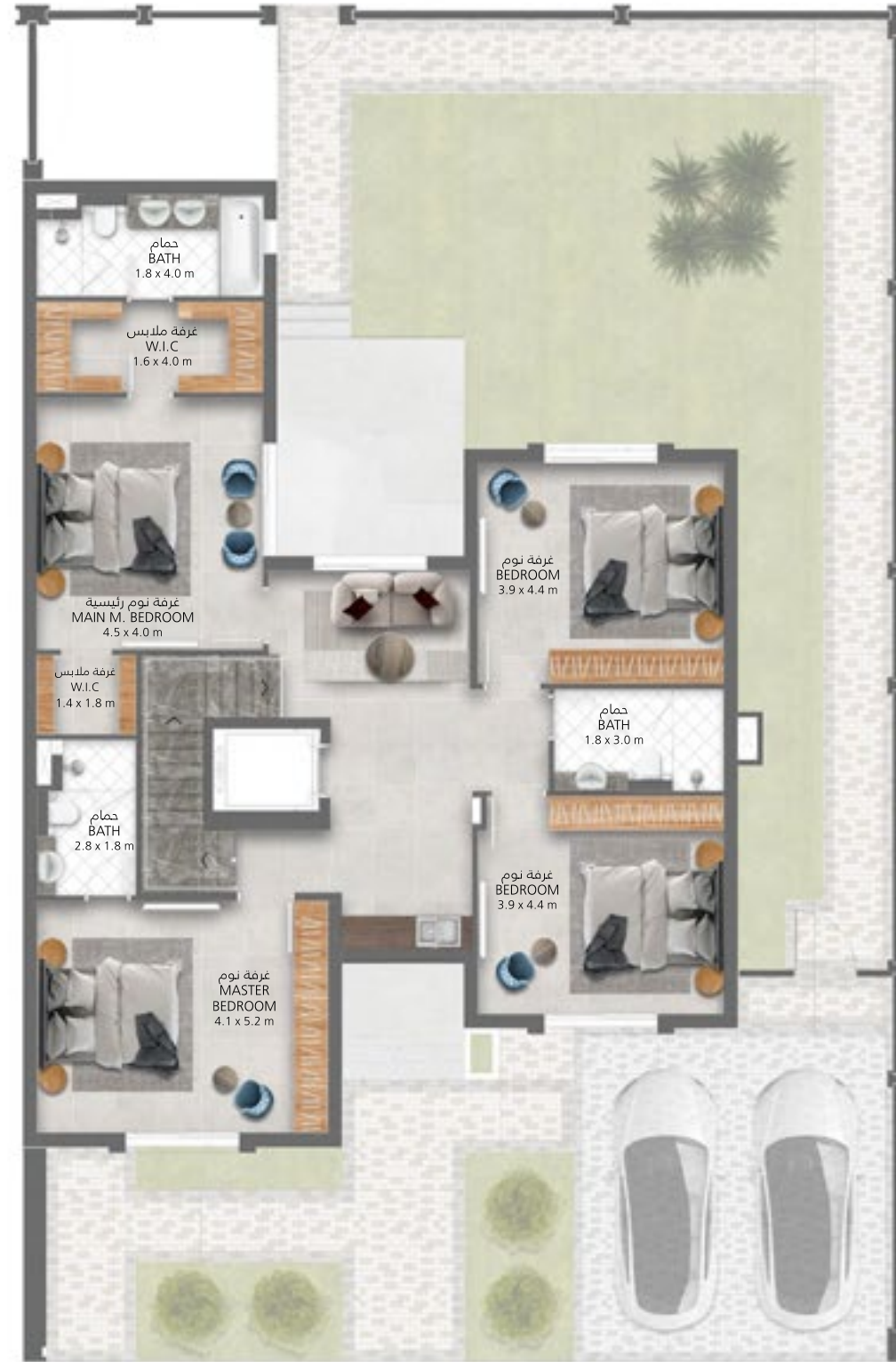
الطابق الأول First Floor