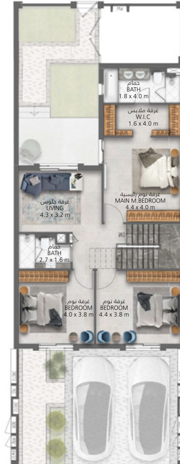
الطابق الأول First Floor