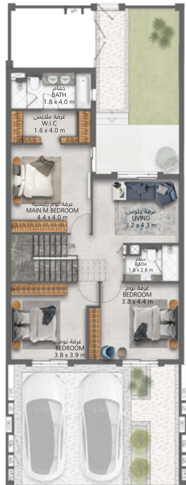
الطابق الأول First Floor