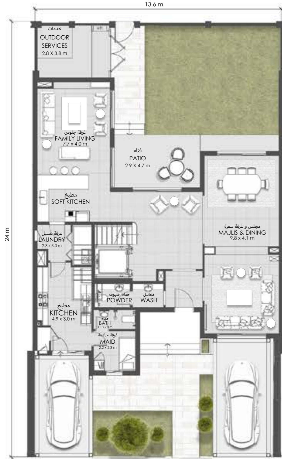
الطابق الأرضي Ground Floor